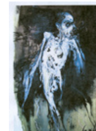
Série Auschwitz technique : huile sur toile