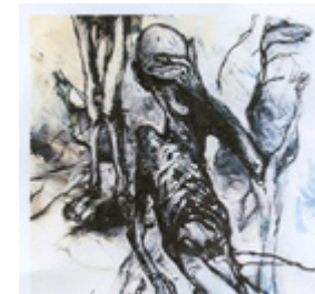
Série Auschwitz technique : graphite sur papier