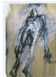
Série Auschwitz technique : huile sur toile

Nous conseillons aux personnes intéressées de se documenter auprès de sa famille pour connaître les expositions en cours qui lui sont consacrées aussi bien en France qu'à l'étranger.